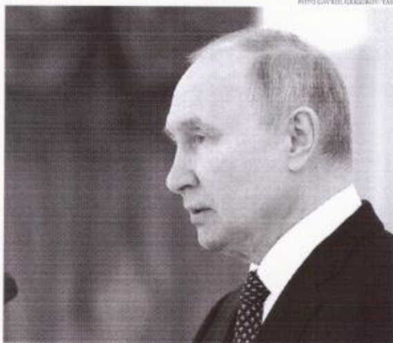
Em discursos de campanha, Putin prometeu tornar a Rússia uma "potência soberana e autossuficiente"

Com o prolongamento do conflito no leste europeu, autoridades de ambos os lados têm falado em uma "nova Guerra fria", que teria como atores as nações ocidentais de um lado e russos e chineses do outro. Segundo